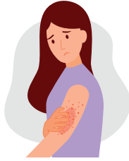
Kurdeşen, Ciltte kızarıklık, Kaşıntı