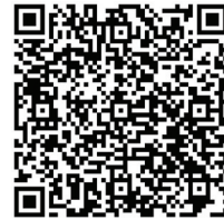
Hero Test (Histamin Eliminasyon Oranı) referanslar için QR kodu okutabilirsiniz.