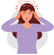
Baş ağrısı, Migren

Histamin intoleransı olan kişiler genellikle vücutlarında dolaşan aşırı histamin nedeniyle çeşitli semptomlar yaşarlar. Histamin reseptörleri vücudun neredeyse her yerinde bulunduğu için, HIT semptomları da oldukça çeşitlidir. Yaygın semptomlar arasında baş ağrısı, migren, kurdeşen, ciltte kızarıklık, kaşıntı, burun tıkanıklığı, ishal, karın ağrısı, düzensiz adet döngüsü ve baş dönmesi yer alır. Bu semptomların şiddeti büyük ölçüde değişebilir ve diğer koşulları taklit edebilir, bu da histamin intoleransının teşhisini zorlaştırır. Histamin açısından zengin gıdalardan oluşan bir diyet, bazı ilaçlar, alkol tüketimi nedeniyle DAO inhibisyonu ve DAO işlevini bozan altta yatan gastrointestinal bozukluklar da dahil olmak üzere belirli faktörler histamin dengesizliğine katkıda bulunabilir.