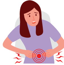
İshal, Karın ağrısı