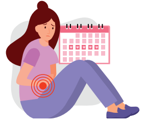
Düzensiz adet döngüsü